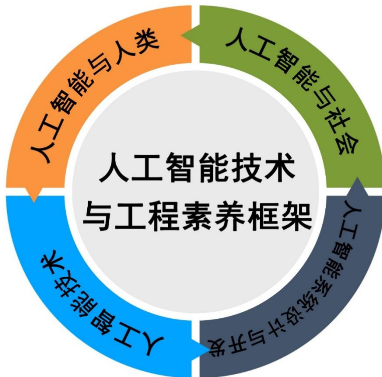
图1 “素养框架”的领域内容

养学生从工程的角度学习、认识和使用人工智能，并主动思考人工智能与人类、与社会的关系。为此，我们开发的“素养框架”，设计了人工智能与人类、人工智能与社会、人工智能技术、人工智能系统设计与开发4个领域内容，如图1所示。